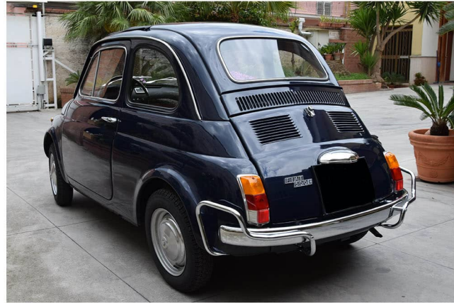
3/4 posteriore sinistro