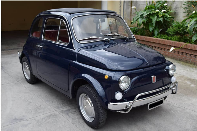
3/4 anteriore destro