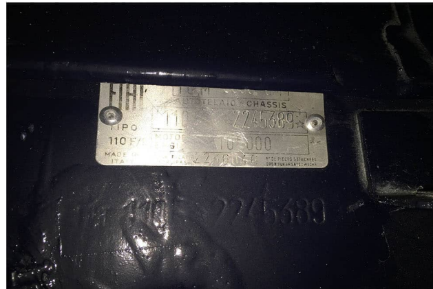
numero di telaio