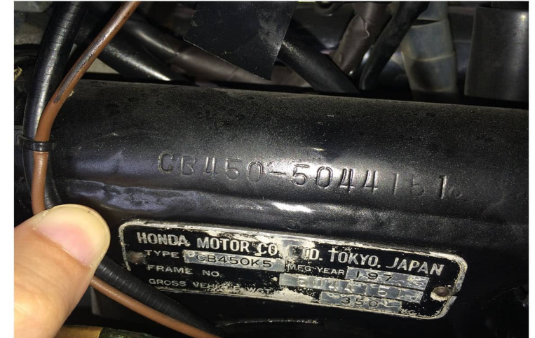
numero di telaio