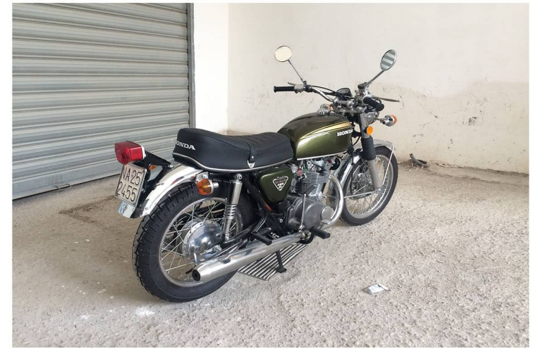
3/4 posteriore sinistro

Documenti: Carta di circolazione (Libretto); Complementare (CDP) Carta d'identità.