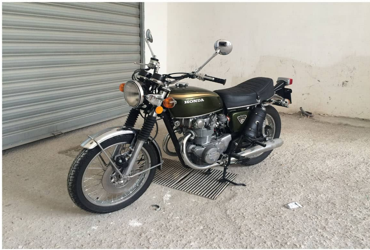
3/4 anteriore destro